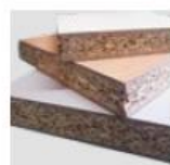
Truciolare rivestito in laminato